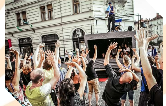
Panorama Kino Theatre

Met een 360° draaiende cinemabox brengt dit Zwitserse gezelschap de magie terug in onze alledaagse wereld. Wanneer het gordijntje opengaat krijgt het publiek een georchestreerde versie van de werkelijkheid te zien, waarin ensemble en voorbijgangers samenzweren.