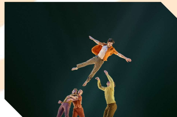
Circa – ‘Humans 2.0’

De Australische rocksterren van het hedendaagse circus brengen een explosieve choreografie die flirt met de grenzen van wat fysiek mogelijk is.