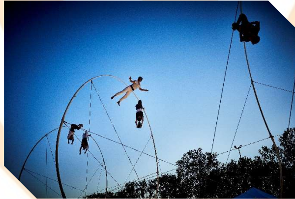
Rhizome/Chloé Moglia – ‘La Spire’

In het midden van Park Spoor Noord verrijst een gigantische spiraal van 7 meter hoog en 18 meter lang. In die ‘tussenruimte’, waar spanning letterlijk en figuurlijk in de lucht hangt, tonen vijf vrouwelijke acrobates dat sterkte en sierlijkheid wel degelijk kunnen samengaan. Laat je meeslepen tot in het oneindige.