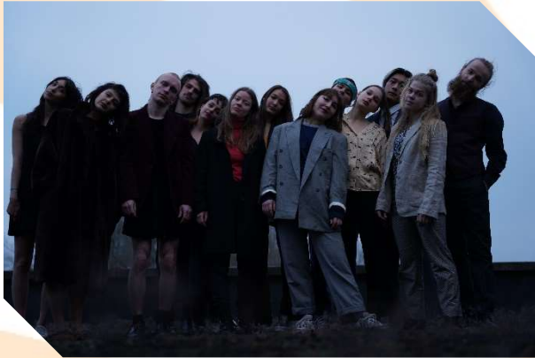
Salement Cirque – ‘Pistes’

Na drie jaar studies aan de Brusselse École Supérieure des Arts du Cirque gaan 13 jonge en minstens even hongerige kunstenaars uit alle uithoeken van de wereld samen op tournee. Stuk voor stuk hebben ze hun discipline geperfectioneerd met een eigen stijl. Hun solo's versmelten tot een volwaardige show.