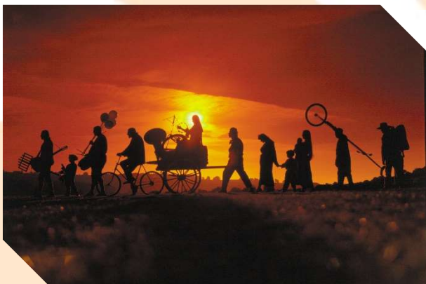
Circus Ronaldo – ‘Da Capo’

De kroniek van Vlaanderen bekendste circusfamilie en tegelijk een geschiedenisles over het ontstaan van het circus. Bovenal een universeel verhaal over liefde, noodlot en passie.