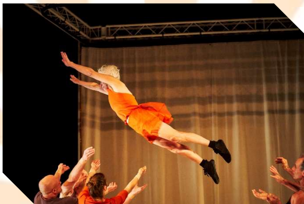
Circumstances – ‘Glorious Bodies’

Onder leiding van de jonge Belgische choreograaf Piet van Dycke tonen zes acrobaten tussen 53 en 67 dat er geen leeftijd staat op waar een goed getraind lichaam toe in staat is.